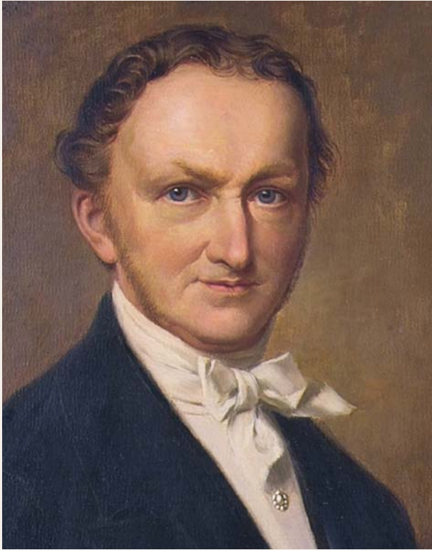
Franz Haniel 1779–1868

Was hat die Haniel Stiftung mit Nachhaltigkeit und mit den Werten der Firma Haniel zu tun? Ob bei unseren Stipendien, Kooperationen, Veranstaltungen oder regionalen Projekten: Die Haniel-Werte ziehen sich wie ein roter Faden durch unsere Arbeit. Denn wir tragen dazu bei, dass viele der von uns Geförderten Verantwortung in und für unsere Gesellschaft übernehmen. Wir sind der festen Überzeugung, dass Bildung hilft, Wandel zu gestalten, Veränderungen zu meistern und Werte zu schaffen. Und wir beweisen, dass es sich lohnt, in Generationen statt in Quartalen zu denken. In Bildung zu investieren beispielsweise, verspricht nicht immer schnelle Ergebnisse, sichert aber langfristigen Erfolg. Denn kaum etwas prägt Menschen so dauerhaft wie Bildung.