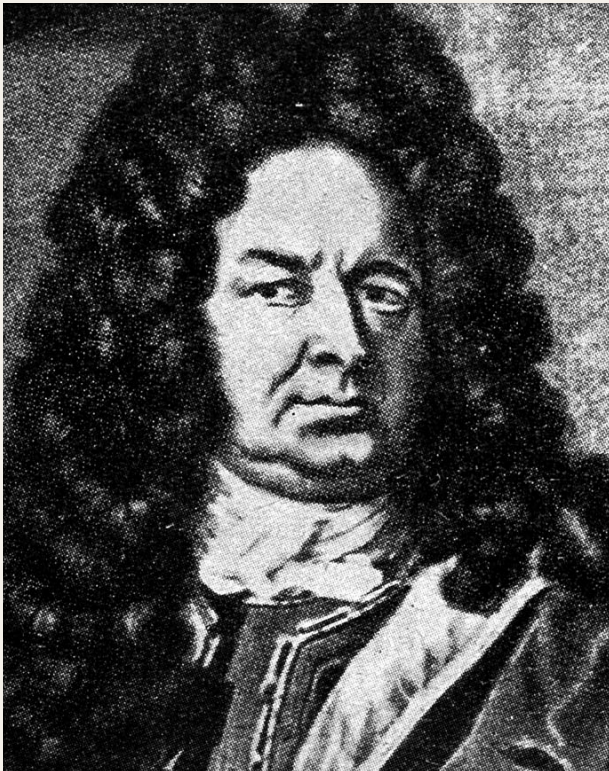
Hans Carl von Carlowitz 1645–1714

Nachhaltigkeit: Im Deutschen mittlerweile ein Allergewort und politisch aktueller denn je. Es ist aber kein Modewort, sondern hat – wie auch unser Stifterunternehmen – eine über Jahrhunderte zurückgehende Geschichte. Als dessen Erfinder gilt Hans Carl von Carlowitz (1645–1714). Der Oberberghauptmann hat das Wort erstmals um das Jahr 1700 in der sächsischen Silberstadt Freiberg gebraucht. Es war ein Kind der Krise: Holz, ein wichtiger Rohstoff für den Silberbergbau, wurde in der Region immer knapper. Ohne Nachschub konnten die Gruben nicht mithilfe von Traghölzern ausgebaut, das Erz nicht durch Feuersetzen abgebaut und die Schmelzöfen nicht mit Holzkohle betrieben werden. Die Situation verschärfte sich zusehends, was Carlowitz veranlasste, ein Konzept zu erarbeiten, um die Bereitstellung ausreichender Holz Mengen für den Silberbergbau dauerhaft zu gewährleisten. Er schlug vor, immer nur so viel Holz zu schlagen, wie durch Wiederaufforstung nachwachsen kann.