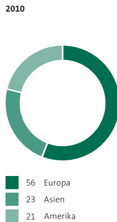
Umsatz nach Absatzregionen in %