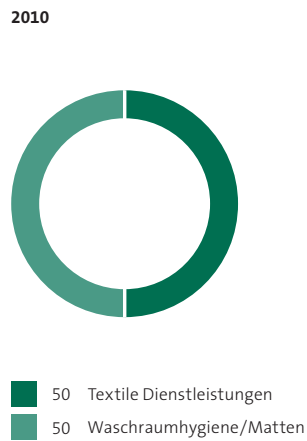
Umsatz nach Bereichen in %