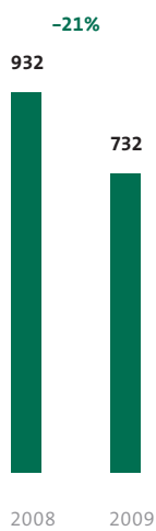
Umsatz Mio. Euro